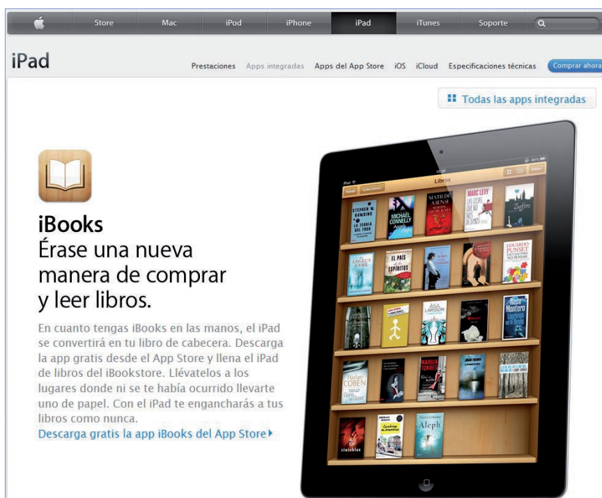
Web iBookStore de Apple, http://www.apple.com/es/ipad/built-in-apps/ibooks.html

Desde hace muchos años la edición se ha caracterizado por su tendencia a la internacionalización y a la concentración de empresas. Los grandes conglomerados editoriales tienen vocación de monopolio, y esto es un axioma para grupos pre-electrónicos como Bertelsmann , Elsevier , Hachette , Planeta , etc.