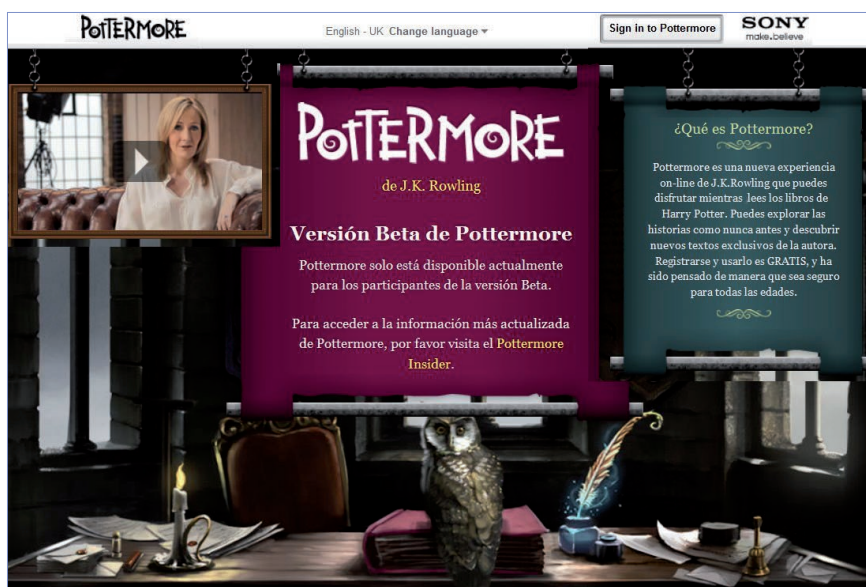
Pottermore es una web para usar mientras se leen libros de Harry Potter, http://www.pottermore.com/es

La unidad de pensamiento puede ser la frase, el párrafo, la sección o el capítulo de un libro. Pero la forma extensa, una historia, un relato unificado, una discusión completa..., ejerce una fascinación, una extraña atracción sobre nosotros. En la Red es lo mismo: podemos cortar el libro en bits y enlazarlos o tejerlos con otros, pero la organización de primer nivel del libro seguirá centrando la atención.