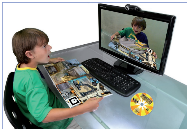
Ejemplo de lectura inmersiva.

El libro es un documento imperecedero, sometido a cambios y transforma-